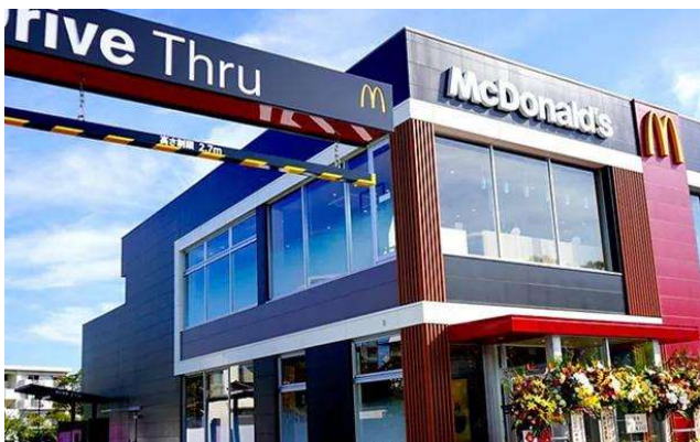
マクドナルド34号東長崎店 様 (長崎県長崎市) ・ 飲食業 ・ 設置枚数11枚