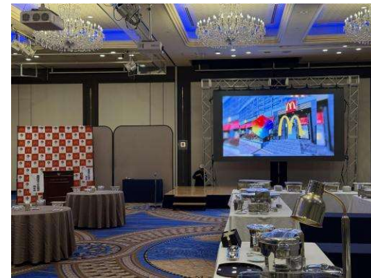
日本マクドナルド株式会社フランチャイジー 有限会社エス・ケイ・フーズ様主催 2025年9月8日に開催されて創立30周年 記念パーティーの様子