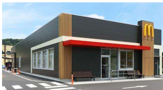
マクドナルド 鹿児島新栄店