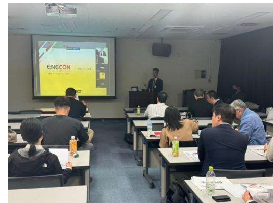
日本マクドナルド株式会社様主催 九州フランチャイズオーナー会議にて エネコン®カードのプレゼンを行う様子