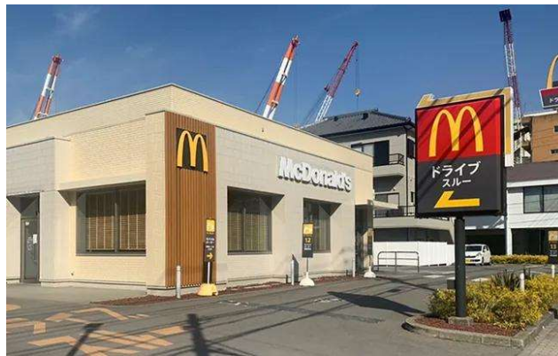
マクドナルド499浪の平店 様 (長崎県長崎市) ・ 飲食業 ・ 設置枚数9枚